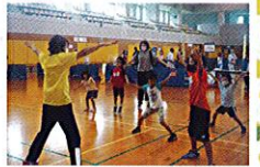
空き時間も運動遊具で遊べるよ♪

1回 30分 ①10:45~ ②11:30~ ③13:00~ ④13:45~ ⑤14:30~